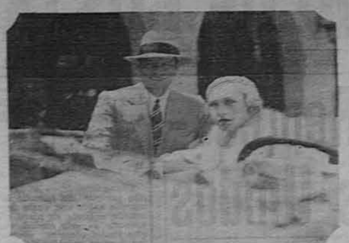
Respetado por los hombres y amado por las mujeres... Eso es Jack Holt en la super-film que se exhibirá por primera vez el domingo en los teatros Variedades, América y Adela...