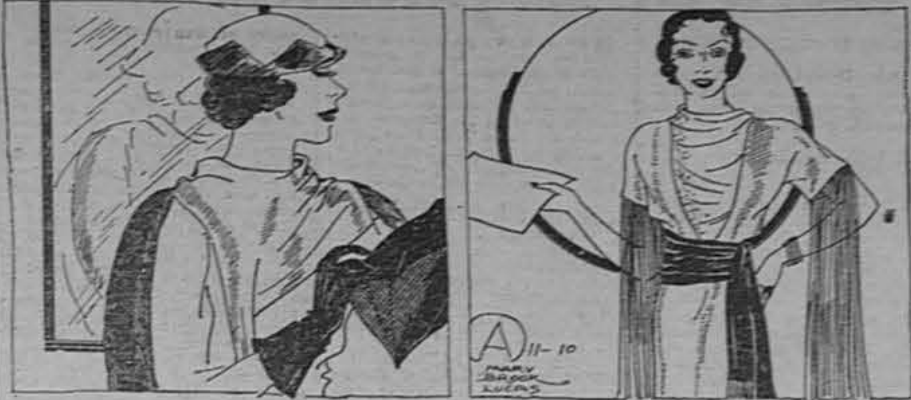
Elegante traje en que se combinan una tela brillante y otra opaca; la primera es un tejido dorado y la otra un crepón de lana...