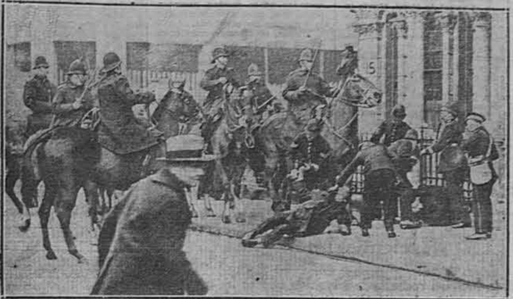
Un aspecto de los desórdenes ocurridos recientemente en Londres, en los cuales la mayoría de las gentes tomó parte con la intención de divertirse y matar el tiempo.

Es probable que la incierta situación política alemana obligue a posponer la conferencia de las cinco potencias