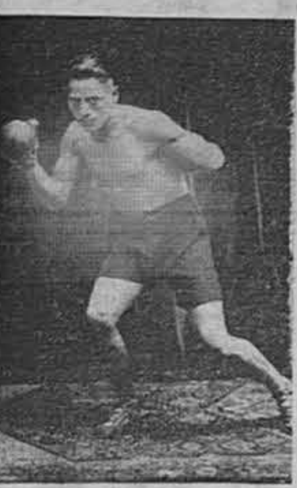
En las conversaciones de corrillos hemos tenido ocasión de oír comentar favorablemente

La exhibición de boxeo internacional ha despertado un enorme entusiasmo como verdadero acontecimiento deportivo