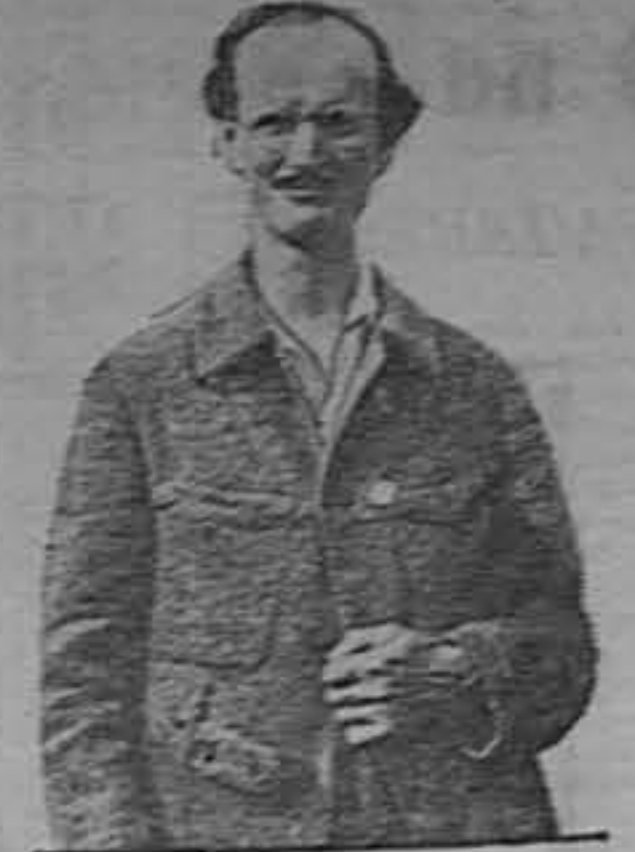
EL PROFESOR PICCARD.

la DORA K estaba en Bocas, pero luego avisó que salía, pasando varios días sin que llegara a Limón. En vista de ello se creyó que podría haberse pasado algo, hasta que anoche, ya en altas horas, la DORA K arribó a Limón. Después de haber usado que arribar varias horas, se desbarató la gasolina que traía, siendo prorrogada entre los expedicionarios, para la gran demanda que había que no se pudieran cumplir los pedidos tal como estaban hechos. Se hizo una reparación completa de las 100 estaciones.